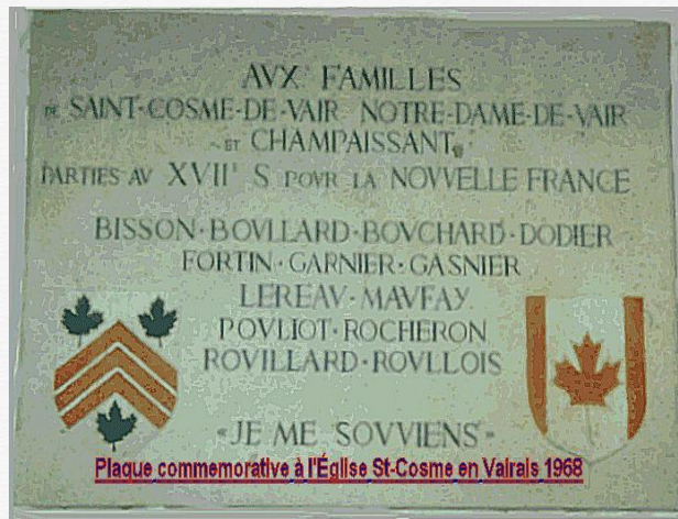
Église de St-Côme-en-Vairais où fut baptisé l'ancêtre Julien