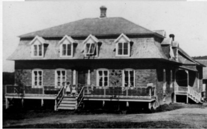
Église Saint-Thomas-de-Cherbourg Maison d'Antoine Gagnon, Saint-Fabien