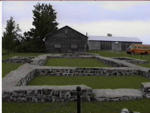
Inscription devant les fondations de la première église de St-Joachim Fondations de la première église de St-Joachim C'est dans cette église de Saint-Joachim que fut inhumé Julien Fortin dit Bellefontaine le 22 novembre 1687